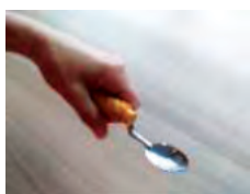
Cuillère anti-tremblements créée par le Rehab Lab de Kerpape (CRRF Kerpape Ploermeur, 56) et imprimée à ALTYLAB